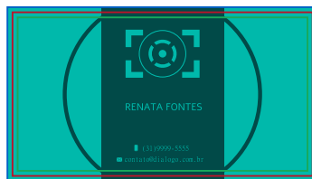
Página 03 (Impressão Verso)