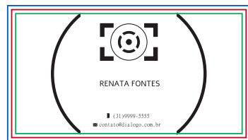
Página 04 (Verniz do Verso) Obs.: 100% de preto(k) em vetor